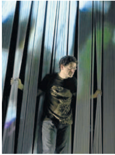
Imagen de la obra.

Partiendo de la sala de ensayos que abandona, su viaje tras la verdad nos lleva a la zona de tránsito del Hades, a la desolación de Grecia, al vacío del oráculo y al mar. Unas transiciones sutiles al igual que la elegancia en su dirección permiten que las escenas fluyan de forma orgánica haciéndonos sentir las heridas abiertas de su desequilibrio personal y de la crisis social que toca. La desesperanza ante la falta de impulso vital, ante el hambre de éxito o frente a una sociedad que nos arrastra a traicionar nuestros sueños es una